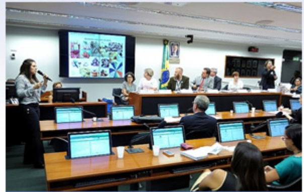
Audiência Pública sobre Alimentos para fins Especiais.