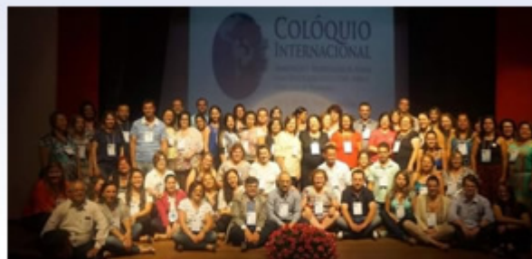
Participantes do Colóquio.