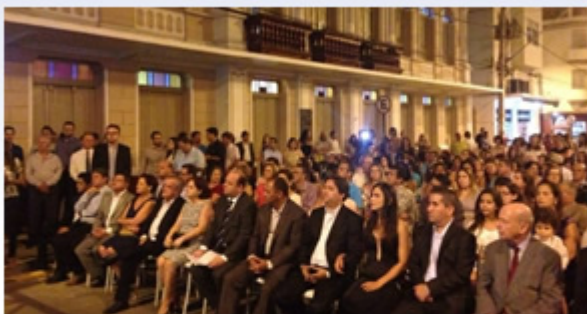
Evento de inauguração.