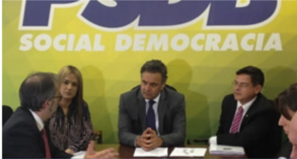
Deputado Eduardo Barbosa, Senador Aécio Neves e os eurodeputados.

06 de novembro de 2015 Informativo nº 190