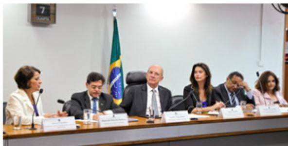
Audiência Pública no Senado.

09 de outubro de 2015 Informativo nº 186