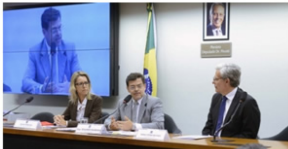
Eduardo Barbosa presidindo audiência pública

02 de outubro de 2015 Informativo nº 185